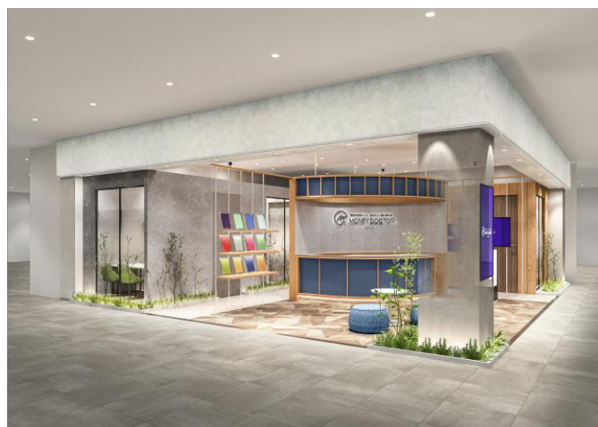
マネードクタープレミア イオンモール橿原店 (写真はイメージです)

また、イオンモール橿原は、橿原市及び大和高田市と地域活性化や市民サービスの向上を目的とした「包括連携協定」を締結しています。マネードクタープレミアでは、生活に欠かせない「お金」のお悩み相談・アドバイスといった面から地域活性化に貢献し、地域の皆さまがいきいきと過ごすサポートをしてまいります。